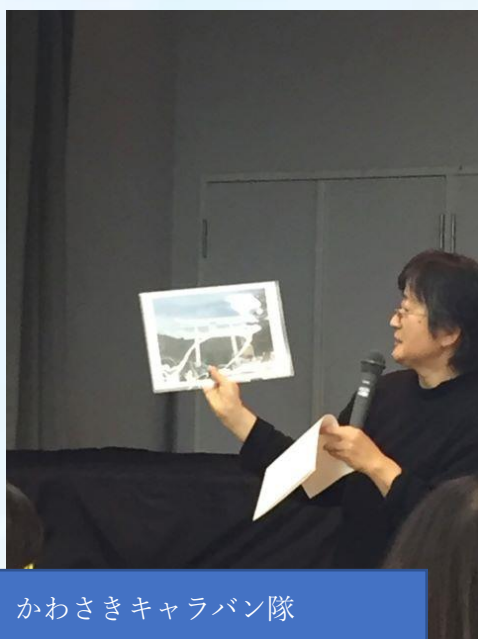
かわさきキャラバン隊 「これなあに？」を公演

台風の被害にあわれた方々へのお見舞いと、かわさきキャラバン隊へのエールを送っていただきました。